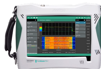
Field Master Pro MS2090A